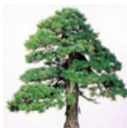
◇町の木 ゴヨウマツ