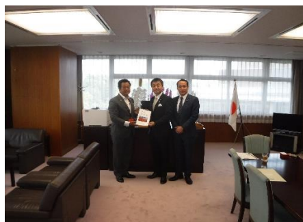
佐々木紀 国土交通政務官