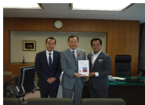
国土交通省 山田邦弘技監