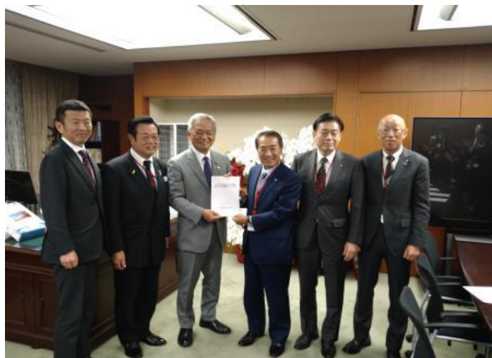
国土交通省 高橋克法 国土交通副大臣 (左から3番目)