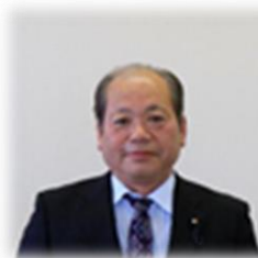
室井 高男 議長