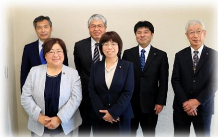
民生文教常任委員