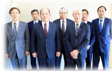
正副議長及び議会運営委員