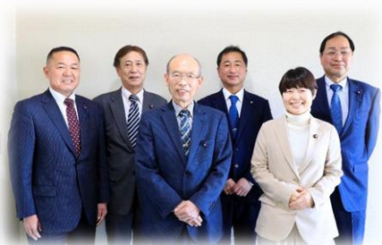
総務産業常任委員