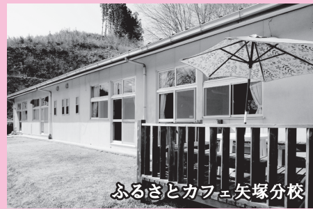
ふるさとカフェ矢塚分校