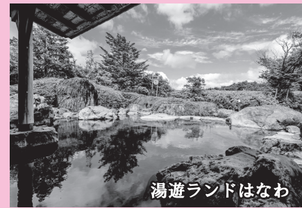
湯遊ランドはなわ

おすすめコース ながらがわけいこく やつかぶんこう ゆうゆう 道の駅はなわ → 那倉川溪谷 → 矢塚分校 → 湯遊ランドはなわ