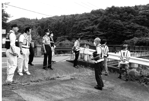
現場検証の様子（大谷開拓橋）

9月14日、主要地方道那須西郷線沿いの大谷開拓橋と池田交差点付近で「とちぎの道現場検証」が行われました。