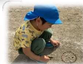
さくらんぼと石で、 顔を作ったよ