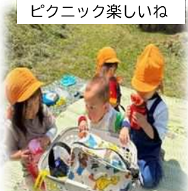
ピクニック楽しいね