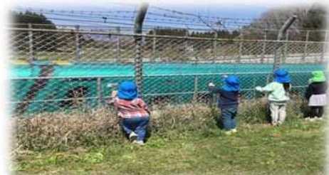
新幹線、カッコイイ～