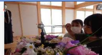
花まつり 甘茶がけ体験