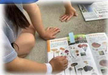
保育園に生えてたキノコ、図 鑑に載っているかな？