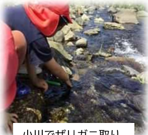
小川でザリガニ取り

0歳児～5歳児のどのクラスも、年齢にあったコースで散策に出掛けています。自然の中でいろいろ発見したり、考えて遊んだり、友だちと楽しさを共有したり、ダイナミックに遊んだり・・・自然で遊ぶ醍醐味を味わっています。