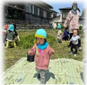
野原でヨーイドン