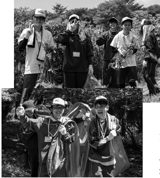
見渡す限りのオオハンゴンソウ… 根っこが固くて一苦労