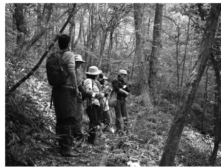
那須平成の森を散策する様子