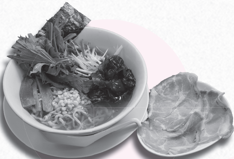
冷たい燻製チャーシューメン 白雪姫(東三島)

※他にもレジャー・スポーツ、ショッピング、温泉など、ジャンルごとにお出かけ情報を配信中。