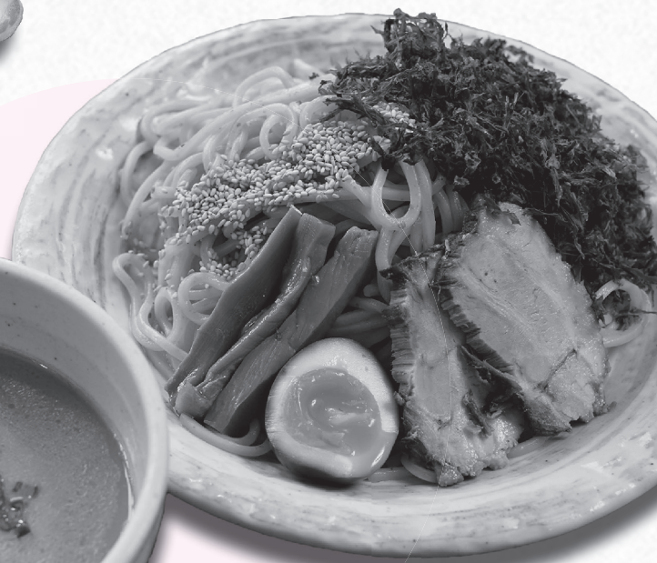
岩のり塩つけめん 竹風 那須塩原店(下中野)