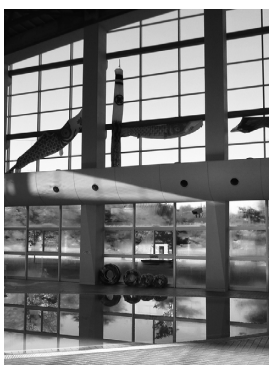
施設内に飾る鯉のぼり