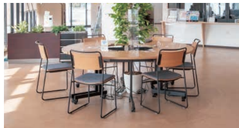
ワークベース那須