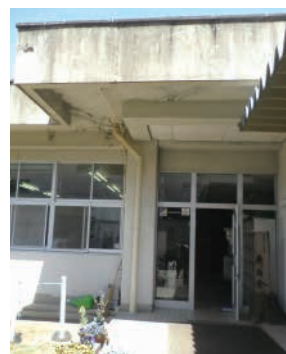
那須特別支援学校寄宿舎入口

答 【学校教育課長】 県の教育長が丁寧な説明をしていくと答弁しており、町としてはまずその状況を見守っていく。