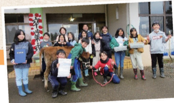
ジャスミン卒業式