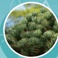
町の木:ゴヨウマツ