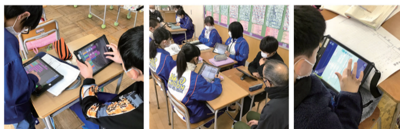
プログラミングにチャレンジ

1人1台の学習用端末を活用して、子どもたちの学びは大きく変化しています。学校だけでなく、家庭でも端末を活用することで、児童生徒一人一人の興味関心に応じた学習活動や課題解決に取り組む機会が増え、学習効果を更に高めていくことが期待されています。