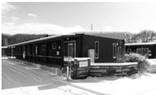
写真は、自立の方向けのサ高住「ひろばの家・那須1」（10棟（49戸））。

らが出席し、完成を祝いました。2018年に「那須まちづくり広場」を開設して以降、カフェやマルシェ等のリニューアル、介護が必要な人向けのサ高住やセーフティネット住宅等の整備が行われ、この度の開設により、那須まちづくり広場が完成となりました。