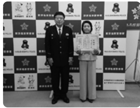
左から、江田那須塩原警察署長、磯さん