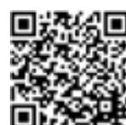
那須町 インターネット公売 | Q