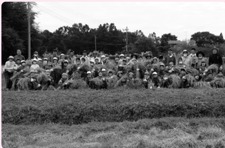
稲の束を重そうに抱きかかえ、満面の笑みでハイチーズ!

10月4日、黒田原小学校で5月に植えた田んぼの稲刈りが行われました。子どもたちがしゃがむと隠れてしまうくらい立派に育った稲。地域のボランティアの指導を受け、鎌を上手に使い刈り取り、束ねて、稲架（はさ）に掛けました。関連記事（23ページ 今月の人）