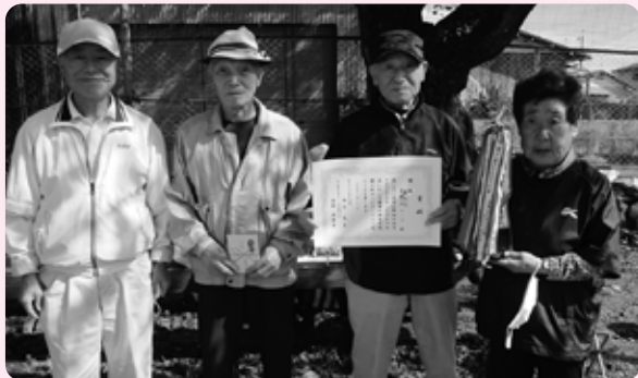
グラウンドゴルフ大会で優勝した長生会チーム

10月21日、伊王野公民館で高齢者スポーツ大会が開催されました。第22回伊王野地区長寿クラブグラウンドゴルフ大会と第32回伊王野地区長寿クラブ輪投げ大会の2種目が行われ、それぞれで優勝を目指し熱い戦いが繰り広げられました。スポーツを通して、人との交流や体力づくりへの興味関心を育むことができました。