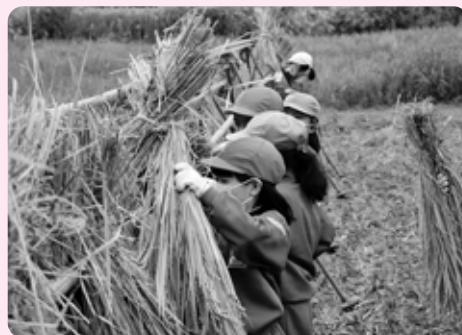
稲架（はさ）に掛けて天日干しをしました