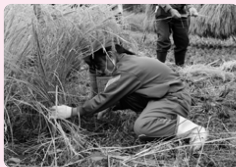
慣れない鎌を使って稲を刈りました