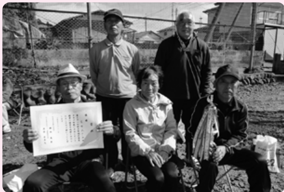
輪投げ大会で優勝した美野沢チーム