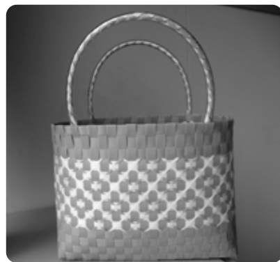
PPバックで作った花模様バック

▼持ち物 ものさしまたはメジャー、はさみ、洗濯ばさみ10個程度 ▼締切り 11月22日(火)