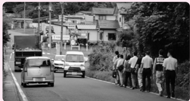
県道豊原高久線（高久駅周辺）

9月7日、町道丸山・松子線（丸山地内）と県道豊原高久線（高久駅周辺）にて「とちぎの道現場検証」が行われました。町長をはじめ県大田原土木事務所、地元小・中学校、自治会の関係者などが参加し、早急に整備が必要な道路について、共通認識を図りました。町長は「道路を利用する地元の皆さんの声を聞かせていただき、安全安心なインフラ整備を進めたい」とあいさつし、参加者からは、要望や意見が出されました。