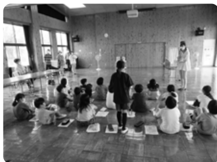
令和4年7月19日 学びの森小学校で認知症サポーター養成講座を開催しました