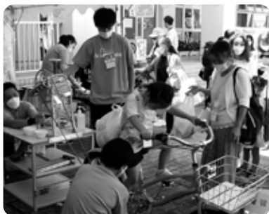
自転車をこぐとあっという間にかき氷ができてあがりました

会場の外では、選手や観覧する皆さんへのおもてなしとして、牛乳とかき氷が振る舞われました。牛乳は、酪農とちぎ那須地域酪農組合と栃酪那須町酪農組合から