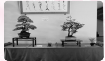
盆栽部による展示の様子