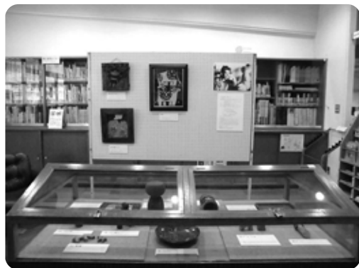
那須町立図書館で展示した時の様子