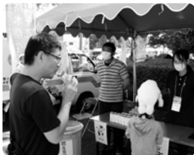
町では、今年4月、那須町牛乳等消費拡大応援条例が施行され、牛乳の更なる消費拡大と普及促進を目指しています

ご協賛いただき、400本が無料配布されました。全国でも有数の生乳生産地である本町の牛乳を味わい、町の魅力を堪能していただきました。 また、自転車をこいで作るかき氷も来場者の皆さんに好評でした。このかき氷自転車は、栃木県立県北産業技術専門校の生徒と教員が設計から取り組み、試行錯誤を繰り返して製作した物です。自分で自転車をこいで作るかき氷の味は格別のように、たくさんの方がかき氷自転車を楽しみました。