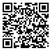
総務省ホームページ

調査をお願いする世帯には、9月下旬に調査員が伺い、調査書類をお配りします。パソコンやスマートフォンで簡単に回答することもできますので、ご協力をお願いします。