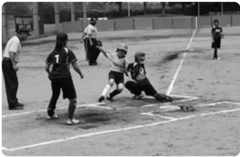
那須町小学生女子ソフトボール大会の様子