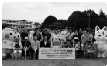
黒田原地区の自治会長をはじめ、多くの親子も参加し、力を合わせて黒田原の火を起こしました

多くの町民の方々の手によって誕生した炬火は、10月1日「いちご一會とちぎ国体総合開会式」で県内各地の炬火が集められ、「とちぎ国体の火」となります。