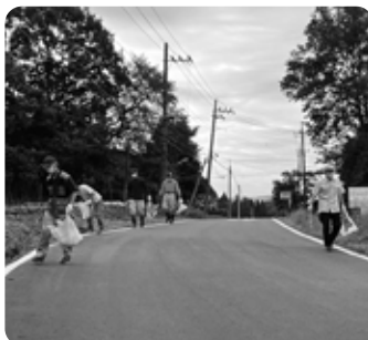
参加者の皆様のご協力により、さらにきれいな町になりました

きれいな大会コースで、全国から訪れる選手や大会関係者の皆さんをお迎えし、心に残る大会になることを期待しています。