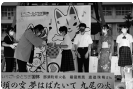
平山町長から受賞者に表彰状と副賞が手渡されました