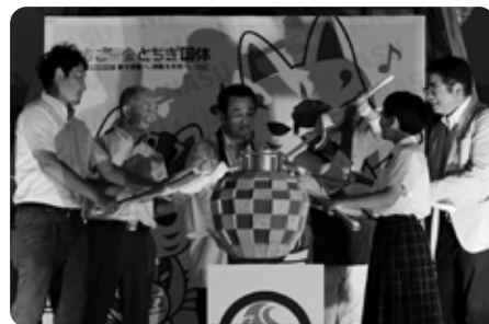
那須町の炬火「那須の空 夢はばたいて 九尾の火」の誕生の瞬間