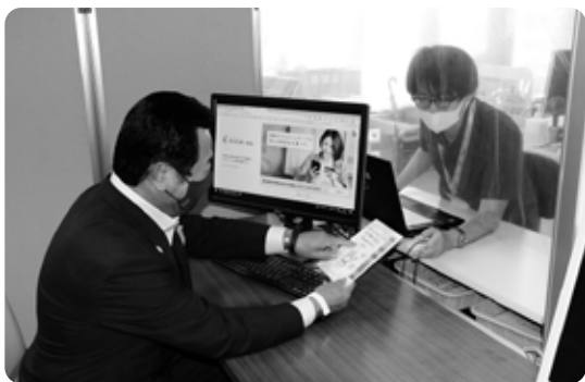
平山町長もスムーズに手続き!!