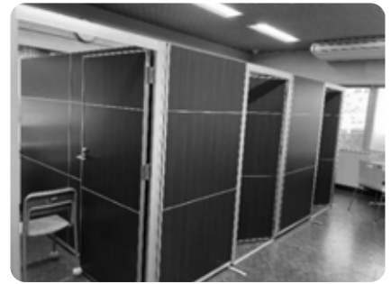
落ち着いて過ごせる静かな個室