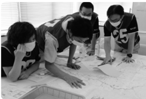
住民から土砂の流入と河川の氾濫により道路が冠水したとの情報が付与。がれきの撤去を事業者に要請できないかなど対応を検討しました