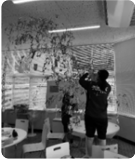
七夕飾りを飾る楽しい行事の一角