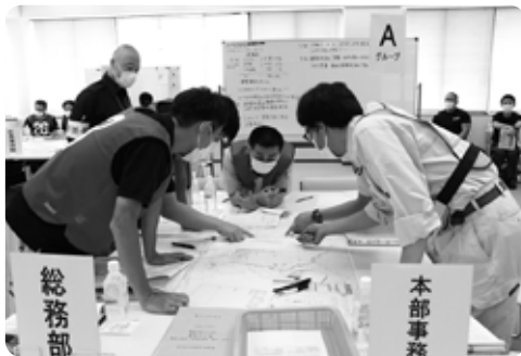
住民から大規模土砂災害が発生したとの情報が付与。人命が関わる状況に対し、何が出来るのか対応を迫られました

住民から寄せられた架空の災害情報や問い合わせ、避難所やインフラの状況把握など、事前予告なく次々と付与される情報に対し、どのような対応をするか検討し判断する訓練を実施しました。