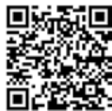
総務省ホームページ

調査をお願いする世帯には、9月下旬に調査員が伺い、調査書類をお配りします。パソコンやスマートフォンで簡単に回答することもできますので、ご協力をお願いします。