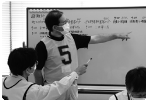
発熱症状があり体調不良の方が避難所にいるとの情報が付与。発熱がある方をどのように避難誘導するか対応を検討しました