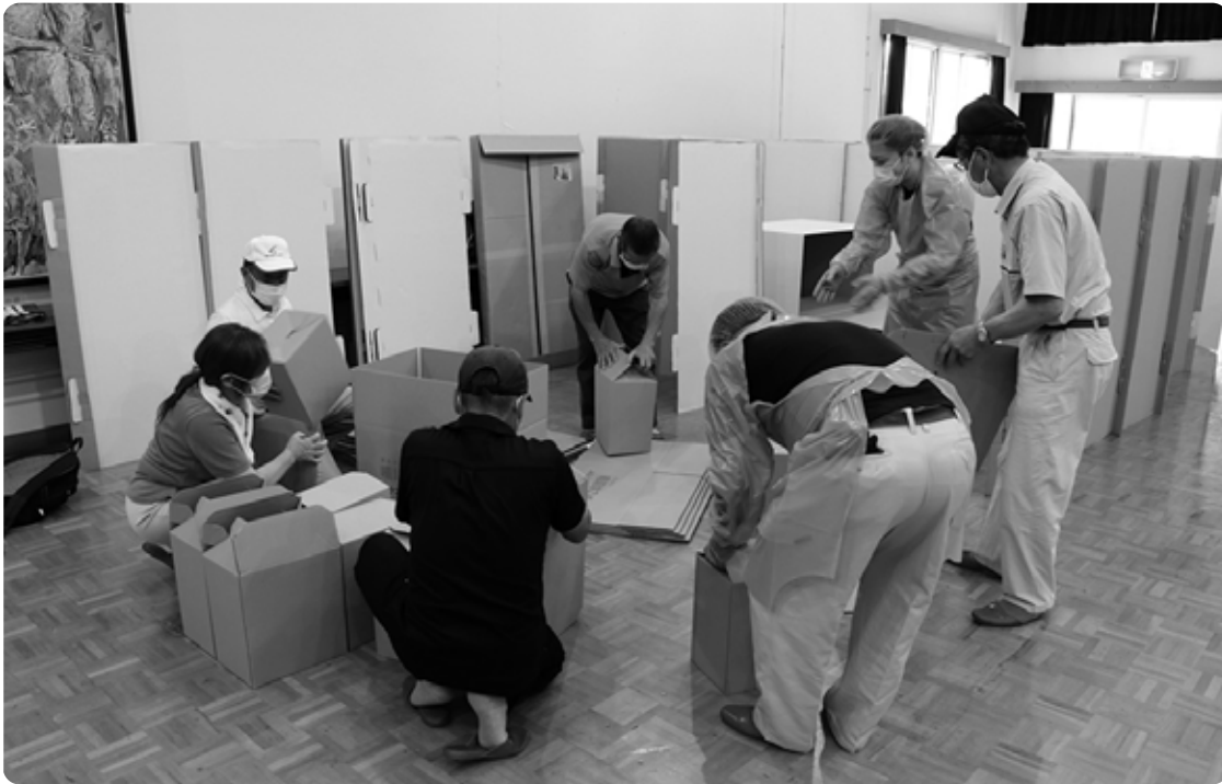
ダンボールベッドを設営体験する様子