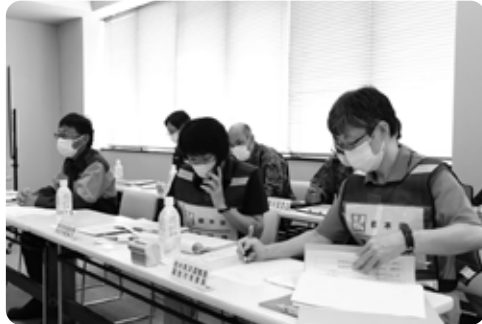
関係各機関と連携し、災害対応にあたりました