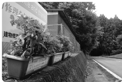
自転車ロードレースコース沿いに飾られたプランターで大会を盛り上げます

▼協力事業所・団体 （一社）那須町観光協会／（有）伊王野オーテック／東山道チャレンジクラブ／道の駅那須高原友愛の森／石川牧場／桃井牧場／今牧場／NANJO FARM／大田原信用金庫黒田原支店／松川屋那須高原ホテル／那須温泉郵便局／伊王野郵便局／芦野郵便局／那須郵便局／那須ワールドモンキーパーク