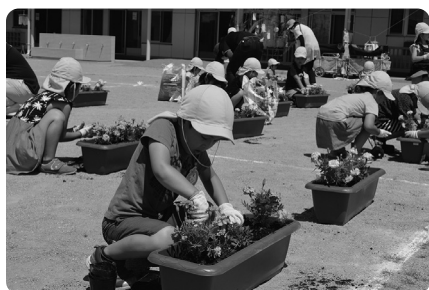
お手伝いで花植えをしたことがある園児も多く、手際よく植えることができました

花いっぱい運動実施中 町民総ぐるみで町を花いっぱいにし、全国から訪れる方々を真心のこもったおもてなしで歓迎するため、花いっぱい運動を実施しています。現在、町内の事業所や団体の方々にご協力をいただき、花とともに応援プレートや選手へのメッセージ入りのシールを貼ったプランターを設置しています。近くを通りかかった際は、ぜひご覧ください。