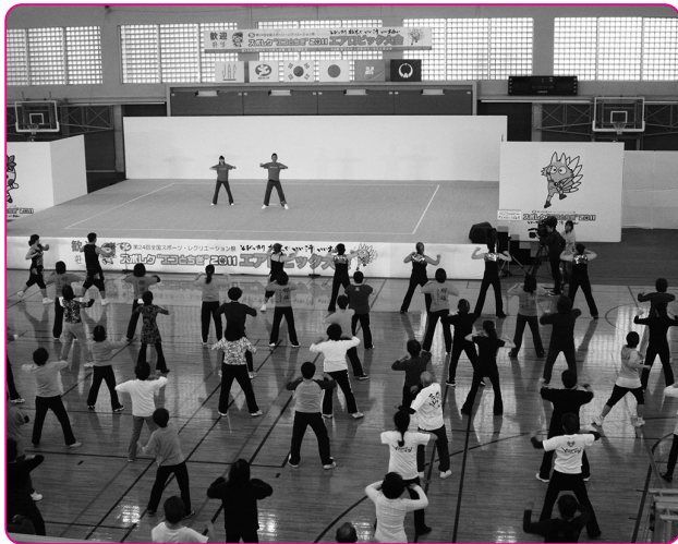
全国スポーツ・レクリエーション祭の様子