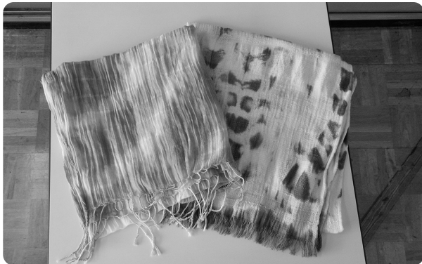
藍色のかわいいストールを作ることができます