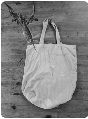
高さ約370mm、マチ約110mm、横幅約360mm、