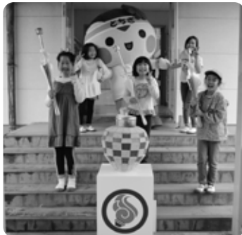
初めての火起こし頑張りました (6/8 高久小)

5月29日に開催された御神火祭、そして6月12日に遊行庵で那須町の火の一部が採火されました。また、町内の全小学校で実施する那須町版放課後子ども教室事業「アナザースクール」でも、採火を行っています。木の板に木の棒をこすりつけて摩擦の力を利用する昔ながらの手法「マイギリ式」の道具を使って火起こしに挑戦し、町内各所で町民の皆さんの手によって、那須町の炬火の一部となる火が誕生しています。今後実施する炬火イベントは、町実行委員会公式ホームページをご覧ください。