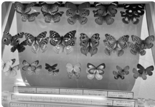
さまざまな種類のチョウを見ることができます