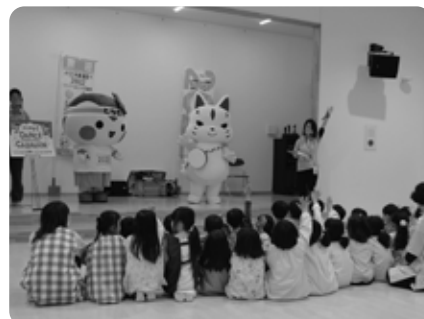
今年4月に開園したなすのそら保育園にダンスキャラバン隊がやってきました (5/31)

▼問合せ いちご一會とちぎ国体那須町実行委員会事務局（教育委員会生涯学習課国体推進室） ☎(74) 5678