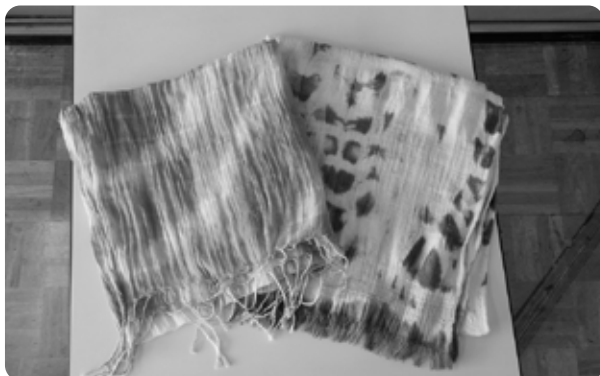
藍色のかわいいストールを作ることができます