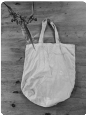
高さ約370mm、横幅約360mm、マチ約110mm