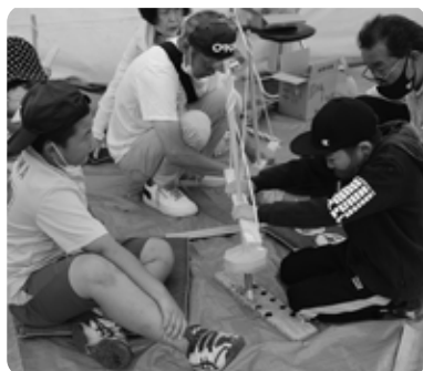
芦野地区の皆さんがマイギリ式火起こし器で採火しました (6/12 遊行庵)