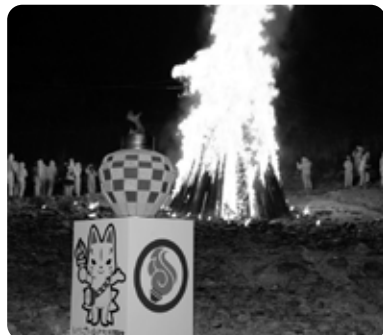
無病息災と豊作を願いミニ炬火台に点火されました (5/29 御神火祭)