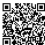
町実行委員会ホームページ

▼問合せ いちご一會とちぎ国体那須町実行委員会事務局（教育委員会生涯学習課国体推進室） ☎(74) 5678