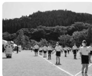
サプライズでとちまるくんときゅーびーが登場！全校生で楽しく踊りました (5/25東陽小スポーツフェスティバル)