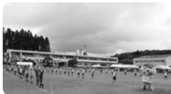
昨年に引き続き1～3年生が元気いっぱいダンスを披露しました (6/9那須高原小スポーツフェスティバル)