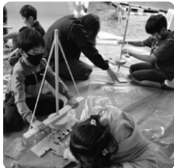
協力して起こした火に大喜びでした (6/15 黒田原小)