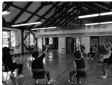
介護予防事業(重度化予防教室)

認知症に関する相談対応や認知症地域支援推進員（通称よりそい隊）が相談に乗り、介護保険の申請や介護サービスの調整をします。