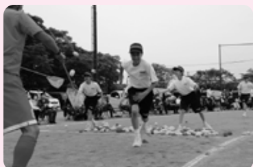
【1年生】忙し障害物競走