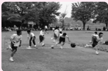
【1年生】カードをめくって借り物競走