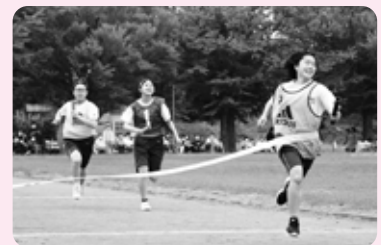
【3年生】クラス対抗リレー