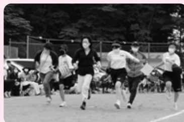
【2年生】わたってかったらかりてこー!