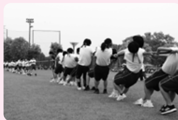
【2年生】力で勝負だ! 綱引き