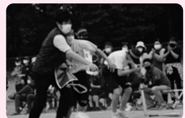
【3年生】走れ! 障害物競走