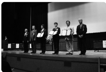
「下田市制施行50周年記念式典」での協定締結の様子

この協定に基づき、今後、政策等の情報交換と質の向上に向けた研さん、災害時の相互連携と支援観光・スポーツ・文化等の分野での相互連携、子どもたちの海・山体験交流事業等を予定しています。