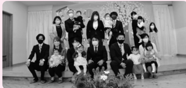
お父さんお母さんに見守られ、今日から保育園に仲間入りです(伊王野保育園)