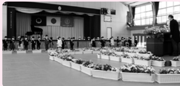
名前を呼ばれると、大きな声で「はい!」と返事ができました(東陽小学校)