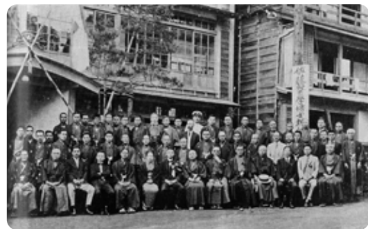
那須村での学位授与祝賀会(昭和3年)

を入口として地域との交流を深め、文化や経済の振興を図ることを期待してやみません。