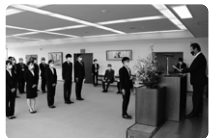
辞令交付式の様子

それぞれの配属先で頑張りますので、役場で見かけましたら、ぜひお声かけください。 これからどうぞよろしくお願います。