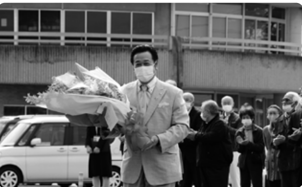
▶初登庁の様子。大勢の町民が役場前に集まりました