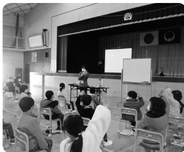
子どもたちにも分かりやすいよう、パネルなどで説明(黒田原小)

人権教室とは、町の人権擁護委員が町内小中学校に赴き、人権について話をする教室です。令和3年12月に、黒田原小学校、高久小学校、那須中学校で実施しました。子どもたちは感じたことを積極的に発表し、真剣なまなざしで話を聞いていました。