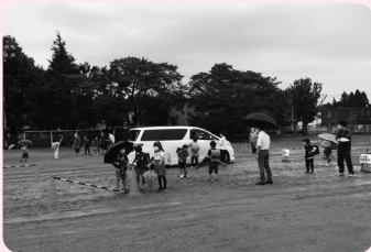
雨の中一生懸命に取り組みました (黒田原小)

災害から命を守るために 小中一貫の避難訓練実施 町独自教材「NAISUタイム」の防災教育プログラムとして、小中学校一貫での合同避難訓練(引き渡し訓練)が、9月2日に那須中学校区で実施されました。 当日は、授業中に災害が発生した場合を想定し、子どもたちは屋外に避難し、学校は保護者へ情報を一斉メールしました。その後、メールを確認して学校へ来た保護者へ子どもたちを引き渡しました。子どもたちが安全かつ速やかに避難し、また、保護者へ確実に引き渡すまでの流れを確認することができました。