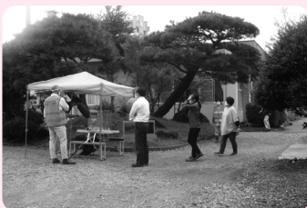
新型コロナウイルスの感染対策も確認しながら実施しました (那須中)