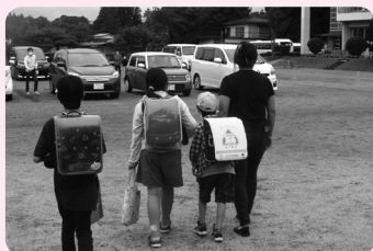
スムーズに保護者に引き渡されました (学びの森小)

同協定は、町民や企業の地域防災力の向上を図ることを目的としており、今後、同社の有する知的・人的資源を有効活用し、相互の密接な連携協力により大規模災害に備えていきます。