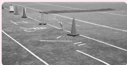
マスク必着や立見席から競技場まで距離を取るなど、各所でコロナ対策を実施