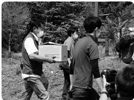
8月3日、ヘリコプターで野生のライチョウが 移送されました

8月3日、野生のライチョウ 7羽が中央アルプスから那須どう ぶつ王国にやってきたことをご存 知でしょうか。国指定の特別天然 記念物であり、絶滅危惧種でもあ るライチョウは、一度は中央アル プスで絶滅したと考えられていま したが、50年ぶりに長野県駒ヶ岳 で生息が確認されました。ライ チョウを繁殖させ野生復帰させる 環境省のプロジェクトを担ってい る動物園のひとつが那須どうぶつ 王国なのです。 那須どうぶつ王国では動物の個 性を生かしたイベントが数多く行 われています。バードパフォーマ ンスでは、タカ・ワシ、ミミズク などの猛禽類やインコたちが、来 場者ギリギリをフライトするドキ ドキのパフォーマンスが行われま す。また、アクアステージでは、 オットセイのバランス感覚や動物 視力を生かしたパフォーマンスを