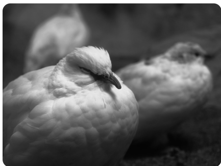
「保全の森」エリアでは、ライチョウを見ることが できます

8月3日、野生のライチョウ 7羽が中央アルプスから那須どう ぶつ王国にやってきたことをご存 知でしょうか。国指定の特別天然 記念物であり、絶滅危惧種でもあ るライチョウは、一度は中央アル プスで絶滅したと考えられていま したが、50年ぶりに長野県駒ヶ岳 で生息が確認されました。ライ チョウを繁殖させ野生復帰させる 環境省のプロジェクトを担ってい る動物園のひとつが那須どうぶつ 王国なのです。 那須どうぶつ王国では動物の個 性を生かしたイベントが数多く行 われています。バードパフォーマ ンスでは、タカ・ワシ、ミミズク などの猛禽類やインコたちが、来 場者ギリギリをフライトするドキ ドキのパフォーマンスが行われま す。また、アクアステージでは、 オットセイのバランス感覚や動物 視力を生かしたパフォーマンスを