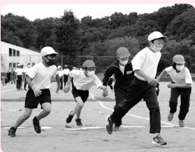
東京オリンピックをモチーフにした障害走。「障害物を駆け巡れ!!」(5・6年生)

災害から命を守るために 小中一貫の避難訓練実施 町独自教材「NAISUタイム」の防災教育プログラムとして、小中学校一貫での合同避難訓練(引き渡し訓練)が、9月2日に那須中学校区で実施されました。 当日は、授業中に災害が発生した場合を想定し、子どもたちは屋外に避難し、学校は保護者へ情報を一斉メールしました。その後、メールを確認して学校へ来た保護者へ子どもたちを引き渡しました。子どもたちが安全かつ速やかに避難し、また、保護者へ確実に引き渡すまでの流れを確認することができました。