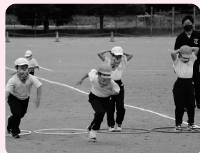
バンダナをマスクにして、忍者に変身!(1・2年生)