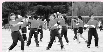
とちぎ国体「いちぎ一会ダンス」を披露。ソーシャルディスタンスを取り華麗にダンス!(3・4年生)

コロナに負けない! 創意工夫の運動会 9月25日、高小で秋のスポーツ祭が開催されました。「やればできる。己の力を出しつくせ」をスローガンに、工夫を凝らしたコロナ対策のもと、子どもたちは全力で競技に挑みました。困難な状況の中でも考え実行することも貴重な経験となりました。