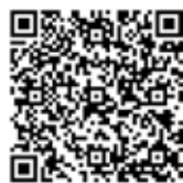
(株)東陽宅建 ホームページ