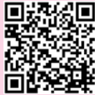
▲広報那須の広告はこちらから