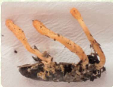
冬虫夏草(とうちゅうかそう)の一つ、サナギタケ。土の中にあつた蛾のサナギから生えていました。

類以上のキノコの仲間が確認されています。実はキノコは「木の子ども」の名の通り、木と深い関係にあります。枯れ木や落ち葉を分解してくれるものもあれば、木と栄養をやり取りして成長を手助けしているものもあります。森を作り、調整する役割を持つキノコが豊富に見られるという事は、森そのものの躍動、そして力強さを表しています。