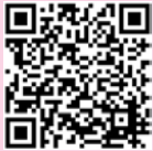
▲ホームページの広告はこちらから