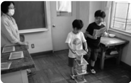
高久小「ボードゲーム」