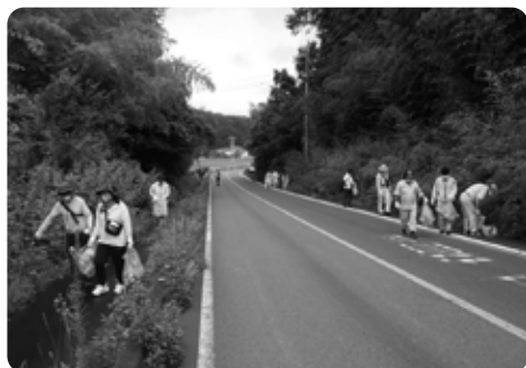
参加した皆さんの協力により、さらにきれいな町になりました

7月25日(日)、大会開催の機運を醸成し、環境に配慮した大会を実現するため、いちご一会とちぎ国体那須町開催競技の「自転車競技ロード・レース」で走行するコー