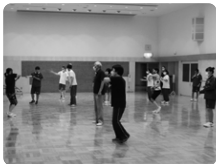
那須高校の皆さんも参加しています