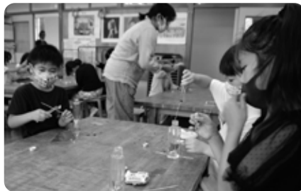
那須高原小「ハーバリウム作り」