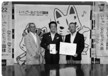
町管工業業組合様から集会用テント2基をご協賛いただきました。(8/4 特別会議室)