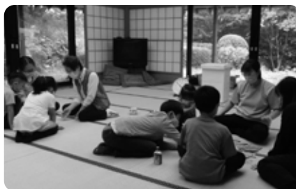
連続講座「百人一首」