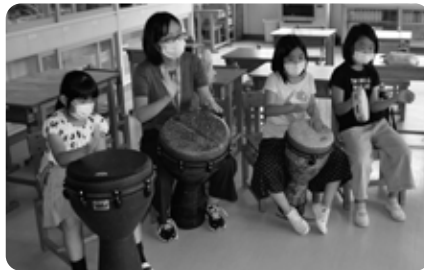
学びの森小「打楽器で遊ぼう」