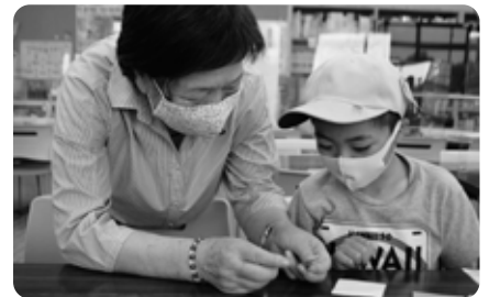
田代友愛小「昔遊び」