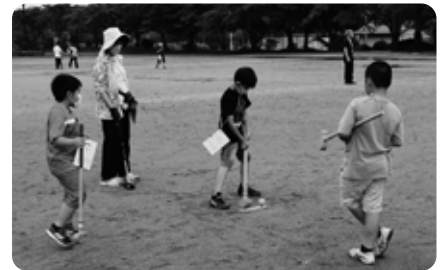
東陽小「グラウンドゴルフ」