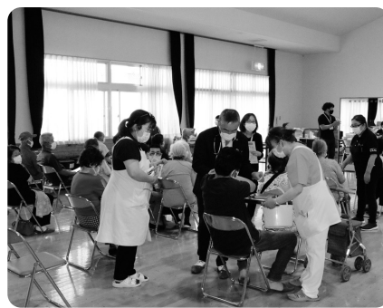
医師が巡回し、接種を行います