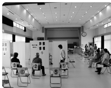
ワクチン接種を待つ様子