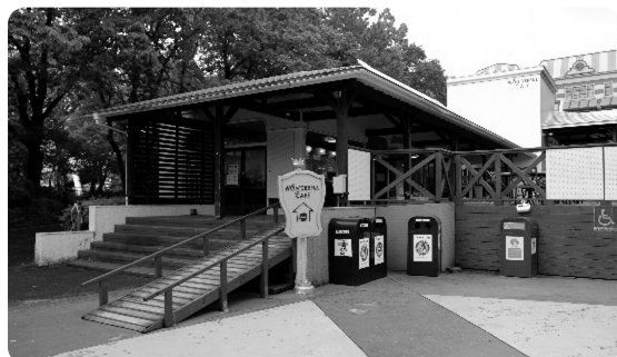
広いスペースを備えるドックカフェ。ペットと一緒にゆったりとくつろげます

那須高原の大自然に囲まれた、北関東最大級の遊園地「那須ハイランドパーク」。近づくにつれて数々のジェットコースターやひときわ目立つ大観覧車がお出迎えしてくれます。 コースターは大人気のぶら下がりの式コースター「F2（エフ・ツー）」をはじめとする絶叫系から子どもも楽しめるものまで全8種類。モーションシートを使用した日本初の3Dシネマティンダートラクション「XDダークライド」などの屋内施設も充実しています。これら約40種類のアトラクションのうち、なんと半数以上が3歳未満でも利用でき、小さな子ども連れでも楽しむことができます。 また、「日本一ペットフレンドリーな遊園地」を目指し、犬と一