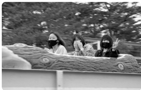
びしょ濡れ確実! ?これからの季節に最高のアトラクションも多数あります