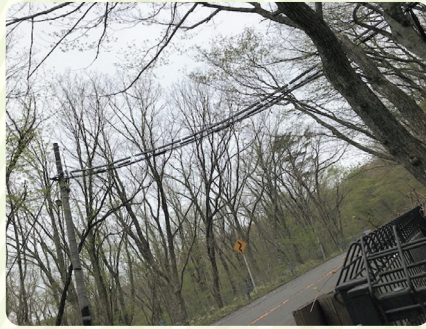
分断された森をつなぐアニマルパスウェイ

「アニマルパスウェイ」とは、動物（アニマル）と通り道（パスウェイ）を組み合わせた造語で、ニホンヤマネやニホンリスのような樹上性小動物が、道路等で分断された森を安全に移動することを目的に設置した「通り道」のことです。この通り道があることによって、ロードキル（轢死や側溝