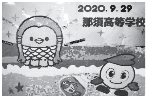
生徒たちが制作した力作のちぎり絵