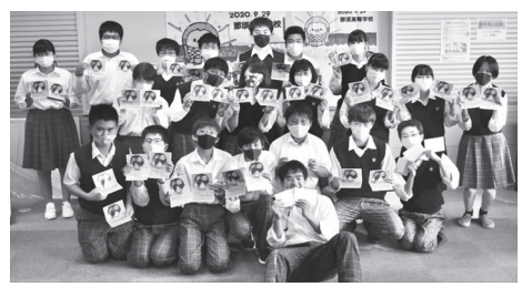
手づくりのメッセージカード