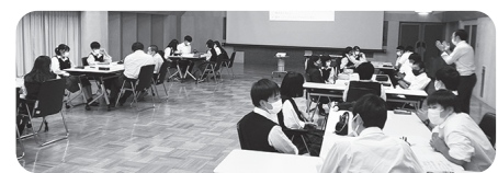
生徒たちが住む地元公民館や社協との交流事業。 ◀ 地元友だちプロジェクトの皆さんに インタビュー ▶

生徒の皆さんが考えた講座、今年やりますよ！ 生徒 友だちと意見を出し合えた。 たくさんのアイデアをもらえました。 生徒 自分が通った小中学校に地元をアピールしたい。 これをきっかけに、どんどん地域活動に参加して下さい。 生徒 話し合いだけでなく、お祭りなどでお店を出してみたい。 学校を会場にしての「講座」なども面白い。 人と人とのつながりが大切。素直な心を持ち続け、みんなで助け合っていきましょう。