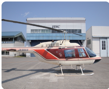
散布に使用するヘリコプター