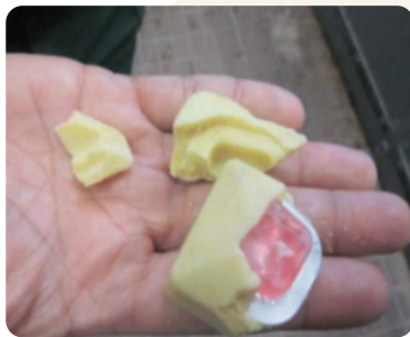
散布する経口ワクチン