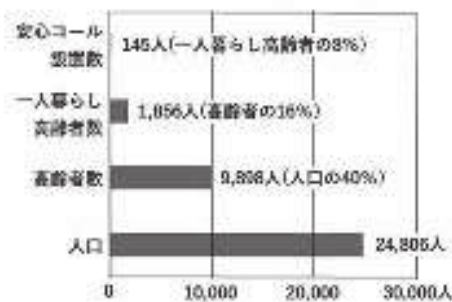
令和2年 安心コール設置状況（那須町）

〔令和2年より、安心コールが無料化となったが、1人暮らし高齢者の8%しか利用されてない。〕