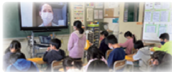
リモートによる町探検(チーズガーデン)

田代小学校と室野井小学校の統合により開校した田代友愛小学校は、広い学区と観光業や酪農、農業などの豊かな地域資源、地域人材を有する利点を生かし、地域に根ざした教育活動を展開しています。総合的な学習での観光施設探検、サマースクール、稲作体験、ブックブックの会による読み聞かせなど、地域と学校の協働活動が定着しています。