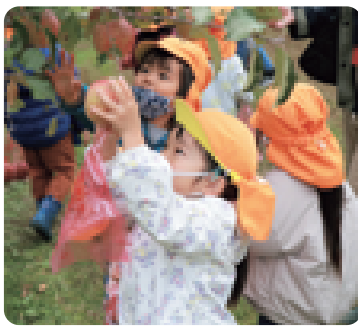
自分で上手に取れました！