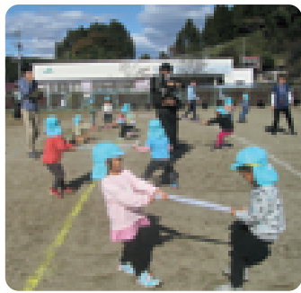
3歳児手ぬぐい綱引き