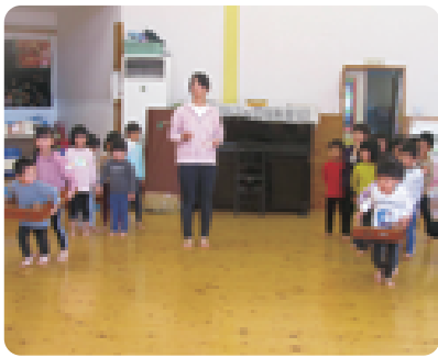
4歳児跳び箱電車競走

県・町では、園児たちの体力向上に向け、各園で運動遊びを行っています。11月5日、伊王野保育園では、とちぎテレビの取材を受け、全クラスで運動遊びを楽しんでいる様子を見せました。 ▼放送日 12月8日(火)午後7時30分～45分「知っとクになるとちっ！」(再放送) ※12月6日(日)に本放送されました。