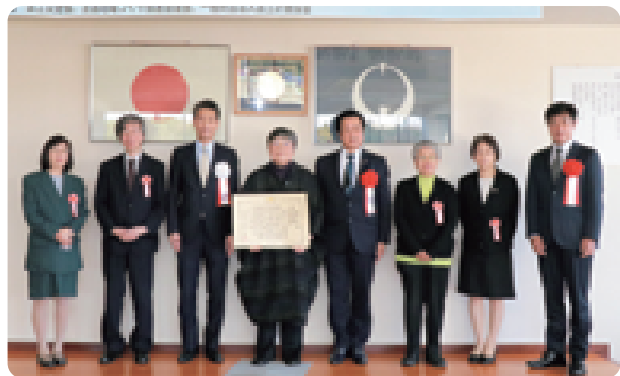
11/5 役場正庁で表彰式