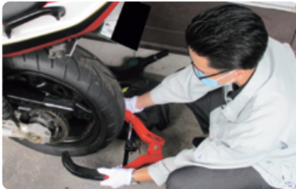
▶差し押さえた自動車等にはタイヤロックし、運行不能にします。