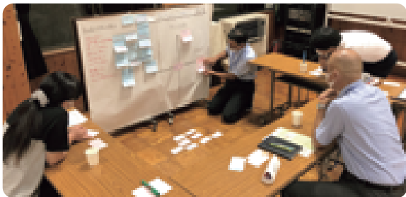
密を避け、同じ方向を向いての熟議

9月11日、町の全小中学校を会場に、幼保小中高合同熟議「第10回和い輪い学習フォーラム」を開催しました。昨年末では文化センターが会場でしたが、今年は町内の各小中学校を会場にして、分散開催しました。