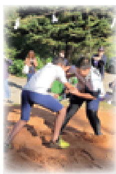
昨年度の子ども奉納相撲

那須小学校で参加していた温泉神社の子ども奉納相撲に、昨年度は那須高原小学校の児童が挑戦しました。地元や育成会の協力を得て、子どもたちは元気いっぱい相撲を取っていました。統合しても那須の人に元気な姿を見せることができました。