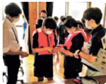
大田原土木事務所の職員による授業の様子

新教科「NAISUタイム」の3本の柱の一つ「防災教育」では、地域との関わり合いをおして、地域特有の災害について学びます。過去の経験を風化させず防災教育を行ってきた自治体では、災害による被害が少なかったことが分かっています。