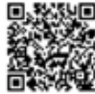
町実行委員会 公式ホームページ

大会情報や開催準備状況など、さまざまな情報を随時更新しますので、ぜひご覧ください。