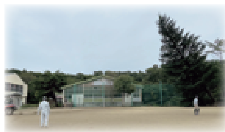
環境整備のため、大型の機械と職人により倒される樹齢50年以上のもみの木

池田、大沢、那須の旧3小学校は、昔から地域とともに子どもたちを育てていました。統合され那須高原小学校になっても学校と地域の結びつきは強く、多くのボランティアが学校に関わっています。また、池田小学校の農園活動、大沢小学校の暁星小学校との交流、那須小学校の子ども相撲奉納など、旧小学校の伝統行事も引き継がれています。那須高原小学校は地域を大切にする気持ちを持ち続け、地域とともにある学校づくりを進めています。