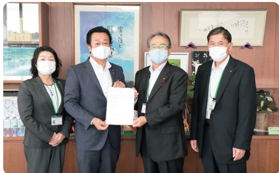
左から磯農業振興部会長職務代理、平山町長、高久会長、井上会長職務代理

町農業委員会から町に「令和3年度町農地等利用最適化推進に関する意見及び町農業等施策並びに予算に関する要望書」が提出されました。