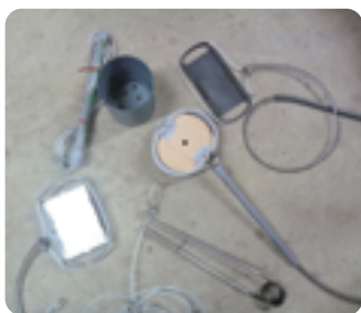
くくりわな。通常は土の中にあり、外からは見えません

■採水地区 上水道未普及地区のうち13カ所で採水 宇田島、六斗地、横岡、三ヶ村、豆沢、明神、山中、寄居大久保、大ヶ谷、黒川、上郷、大和須、梓 ■問合せ 環境課放射能対策係 ☎72-6940