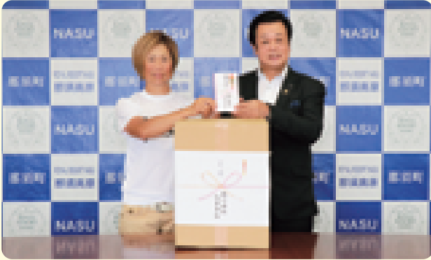
株式会社Spesさまからマスク1000枚と寄付金をいただきました (8/4 特別会議室)