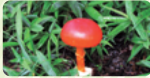
8月〜9月はあちこちでタマゴタケが

高原にある那須平成の森の夏は短く、お盆を過ぎれば秋風が立ち始めます。夏の風物詩エゾゼミの鳴き声と同時に、秋の花ヤマハギが咲き、ススキの穂が風になびきます。トンボの仲間アキアカネも群れをなし、追いかける子どもたちの声が響きます。森の中では赤く色づいたキノコ、タマゴタケが彩りを添えます。