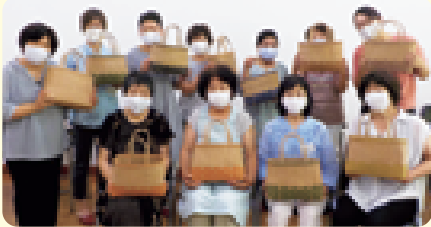
▲オシャレなバックが完成しました(8/25)