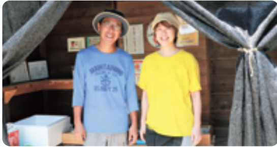
自宅横の小屋では、その日収穫した野菜を販売しています (無人販売・水曜日定休)