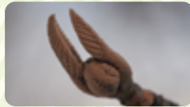
愛らしいオオカメノキの冬芽

9月、秋の虫たちの合唱と共に、ヤマトリカブトやリンドウが濃いブルーに咲き、ダケカンバは早々に黄色い葉を散らします。紅葉のピークは、10月中旬から下旬、11月の始めには終わります。新緑から紅葉まで、6カ月ほど私たちを癒してきた植物の緑や紅葉も見納め。やがて、茶臼岳から吹き降りる風で、11月下旬には木々たちは完全に葉を落としますが、一方で、