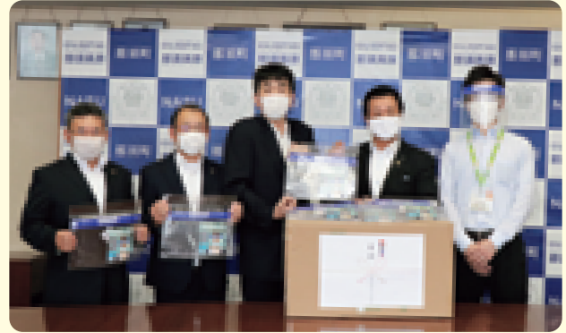
那須野ヶ原ライオンズクラブさまから町内の小中学校教職員へフェイスシールド340個をいただきました (7/31 特別会議室)