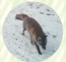
冬、ホンドギツネは食べ物を探して歩く、歩く

前回の結びに、「様々な生き物たちがつながり合って生きている」と記しました。私は10年、自然の様子を観てきましたが、年を