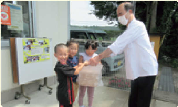
菓子工房Katsumi(かつみ)さんから、町内の7保育園の夕涼み会にあわせて、ミニケーキ300個をいただきました。8月6日には、黒田原第2保育園の年長児にミニケーキが手渡されました。