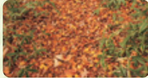
10月を過ぎると森は落ち葉のじゅうたんに

9月、秋の虫たちの合唱と共に、ヤマトリカブトやリンドウが濃いブルーに咲き、ダケカンバは早々に黄色い葉を散らします。紅葉のピークは、10月中旬から下旬、11月の始めには終わります。新緑から紅葉まで、6カ月ほど私たちを癒してきた植物の緑や紅葉も見納め。やがて、茶臼岳から吹き降りる風で、11月下旬には木々たちは完全に葉を落としますが、一方で、